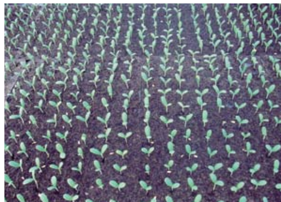
採用穴盤育苗，苗株整齊度高，方便栽培管理。