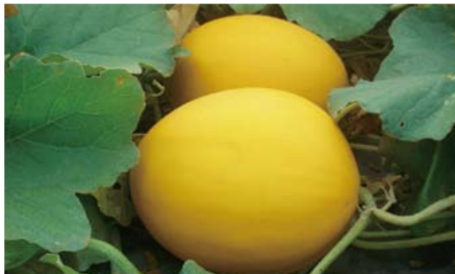
成熟果實皮色金黃，外觀亮麗，超吸睛。

「月香」屬早生品種，栽培期溫度過低時，果實肥大不良，果實較小。若栽培期溫度過高時，則果面稍有溝肋發生。因此，必須把握最適合播種期播種，以免影響果實外觀及產量。🌱