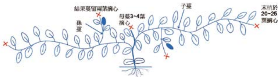
「月香」匍地栽培整枝留果示意圖

每分地(約10公畝)施用「滿地王」特效有機質肥料600公斤左右、「台肥43號」複合肥料100公斤及過磷酸鈣40公斤，作基肥全面撒施，作畦培土一次完成，生育期間不必再施肥。保肥力較差的土壤，視植株生育情形，必要時再以液體肥料補充之，如「葉綠精」500倍等。