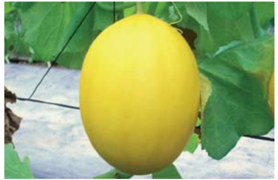
「月香」屬早生品種，果皮轉色快。