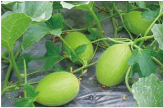
「月香」品種雌花安定，結果力強。