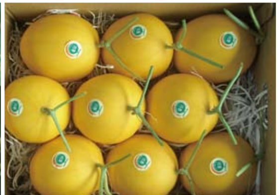
「月香」果實分級包裝