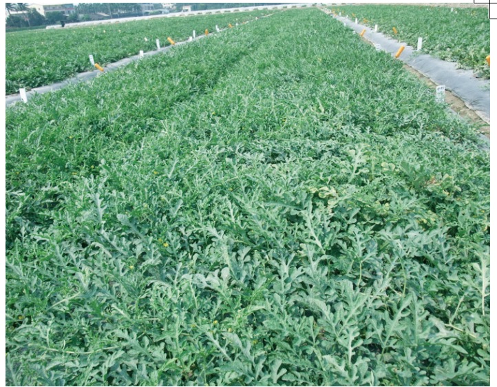
「愛鳳」植株田間生育健壯

於砂質地栽培時較易缺硼。當植株成長到母蔓的第10葉左右時，將硼砂加水400倍均勻噴灑於葉面預防，此後每隔約二週噴施一次連續2次，若發現植株新梢有節間變短、莖部橫裂且有深褐色膏狀物流出之缺硼症狀時，應即時噴施。症狀嚴重時可用200倍硼砂稀釋液澆灌根頭部附近，每株200c.c，5至7天一次，連續2至3次。硼為植物生長所必需之微量元素，不易溶於水，因此，使用時應特別注意稀釋倍數，充分攪拌並待其完全溶