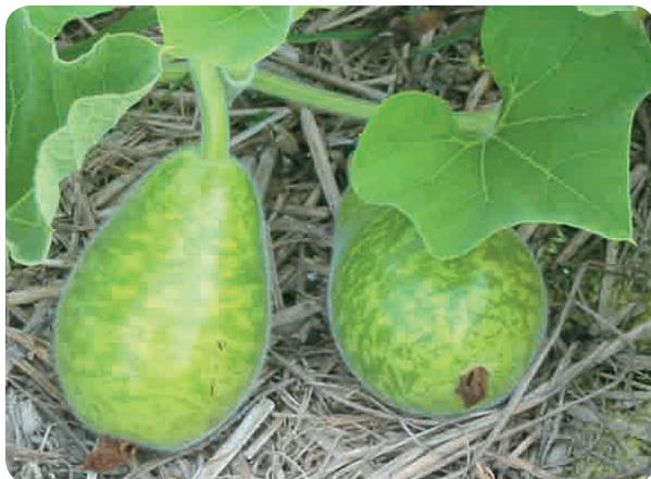
「永芳」蒲瓜以子蔓結果為主

蒲瓜生育期長且可連續採收，為確保果實收量與品質，除應注重有機質肥料之施用外，並於開始採收後每隔約10~15天應施追肥一次，但須視蒲瓜生育狀況酌予增減，勿於雌花始花前施用過量氮肥，以免營養生長過旺，延遲雌花發生。每分地之施肥量：