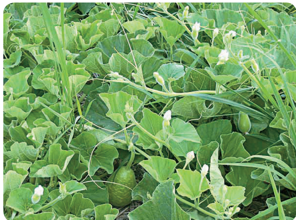
「永芳」的果型不易彎曲變形，可行匍地栽培