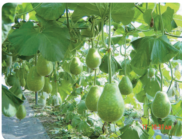
植株生育旺盛，結果力強