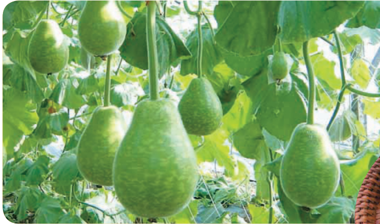
果實呈洋梨型，果皮綠色具虎斑花紋