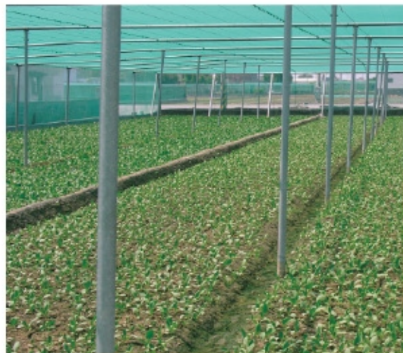
利用網室栽培可減少雨水沖刷

青梗白菜生育期短、適應性廣，在台灣週年可栽培，生育適合溫度15~32℃。以砂質壤土栽培為宜，條播、撒播、穴播等方式