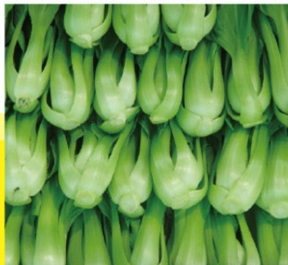
採收清理後準備出售