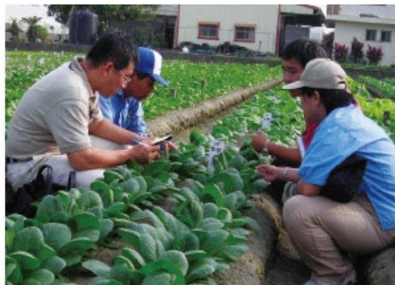
田間品種調查比較

注意小菜蛾、夜盜蟲、紋白蝶、黃條葉蚤、蚜蟲等之為害，防治方法可參考《植物保護手冊》推薦之藥劑。①