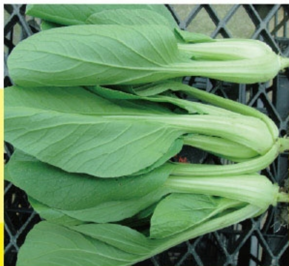
「綠愛」葉柄肥厚、束腰型美。