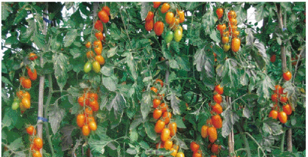
植株生育強健，結果豐多。

序以噴灑一次為原則，否則易造成果實畸形及空心)，施藥時間建議以下午3點後為宜，並須特別注意噴頭加蓋，以防傷及芽頂，造成萎縮及葉變狹小。