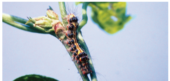
台灣黃毒蛾取食葉部