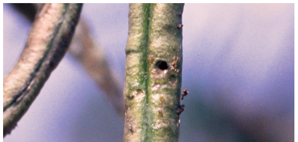
豆莢螟為害豆實外有蛀孔