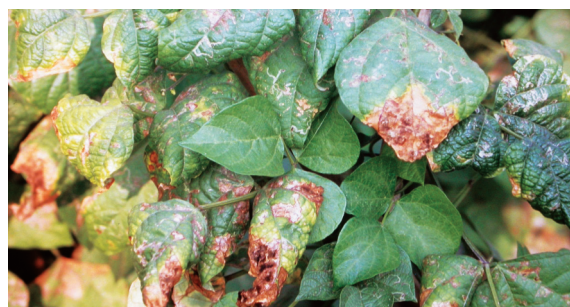
番茄斑潛蠅為害豆葉情形

本蟲俗稱「繪圖蟲」或「二輪蟲」，除為害豆科蔬菜外，尚可為害十字花科、葫蘆科作物。其成蟲體小，活動力強，侵入性亦快，為園藝作物重要害蟲。一般於豆類蔬菜初植1~2月內受害最重，其成蟲通常於田間活動，先以產卵管刺破幼葉葉片表皮，將卵產入葉肉內，卵孵化後幼蟲在葉肉潛食，致使葉片上呈白色曲線食痕，嚴重時可導致葉片枯萎，幼蟲老熟後化蛹於葉背或根部附近土壤。