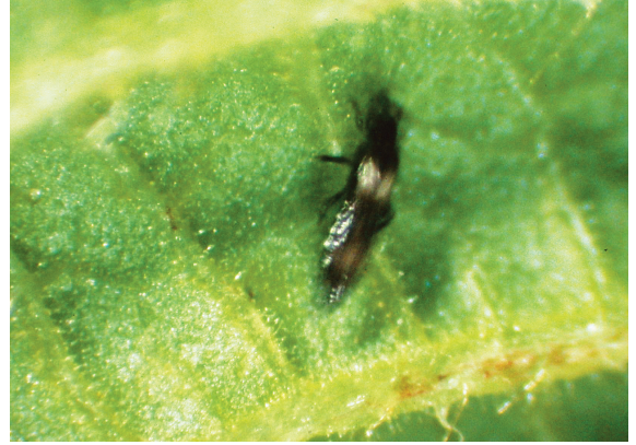
豆花薊馬為害情形