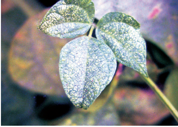
葉蟻為害葉面呈現白色斑點