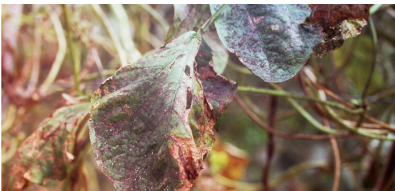
銀葉粉蝨若蟲為害葉片枯萎