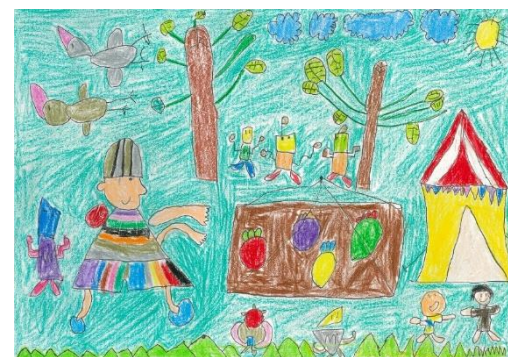
台南幼兒園組-冠軍